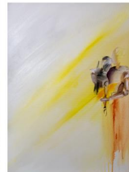
angenommen 70 x 50 cm