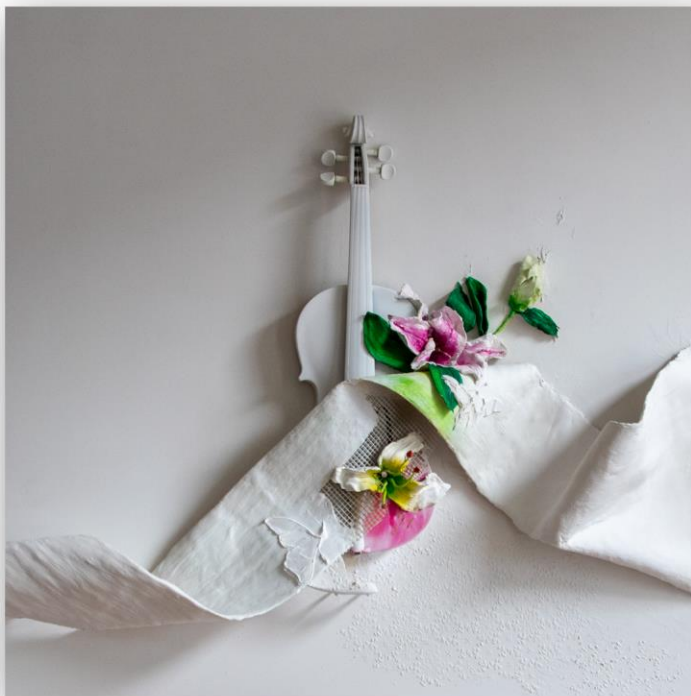
Sound of Healing 1 500 € 100 x 100 cm