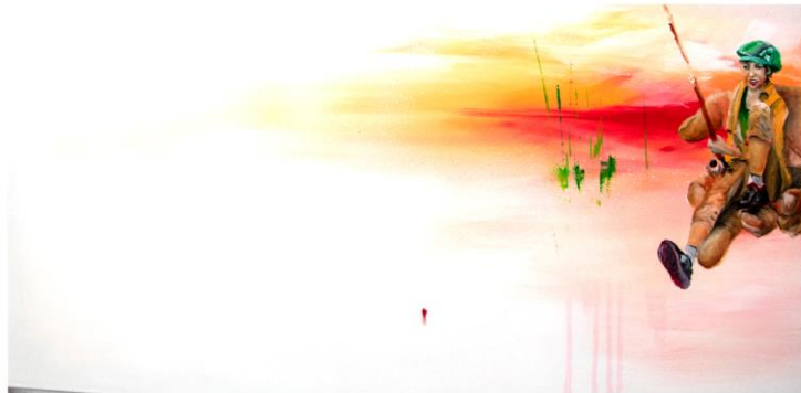
place to be 500 € 100 x 50 cm