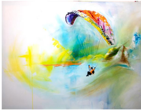
Way of Light 1 500 € 120 x 90 cm