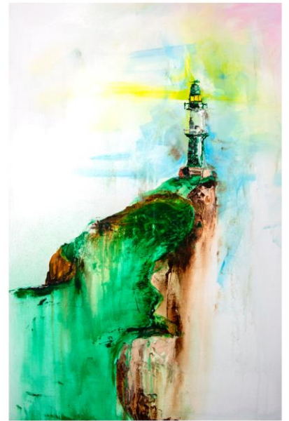
Wegweiser 500 € 90 x 80 cm