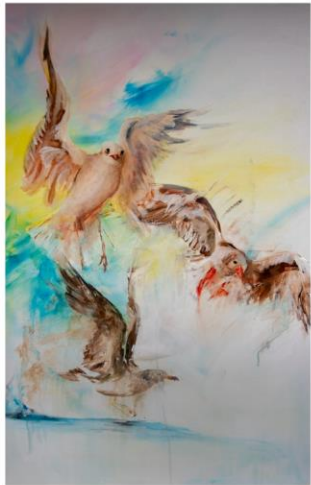
voller Leben 500 € 90 x 80 cm