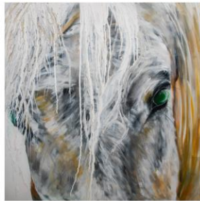
Trost 80 x 80 cm