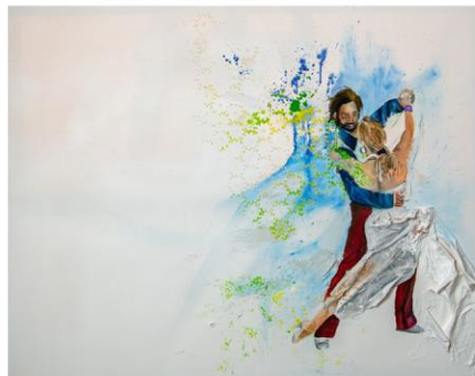
Liondance 80 x 100 cm