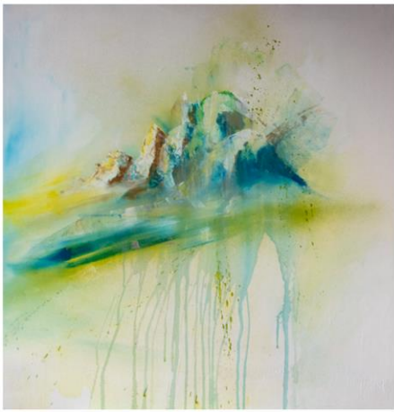
Way of Light 2 500 € 90 x 90 cm