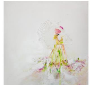
kindl. Leichtigkeit 90 x 90 cm