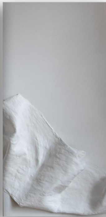
Sound of Healing 2 250 € 100 x 50 cm